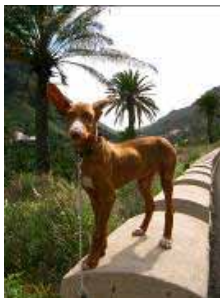
Neo (San Sebastián)