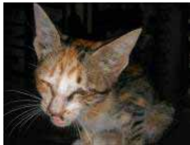
Catalina (Valle Gran Rey)